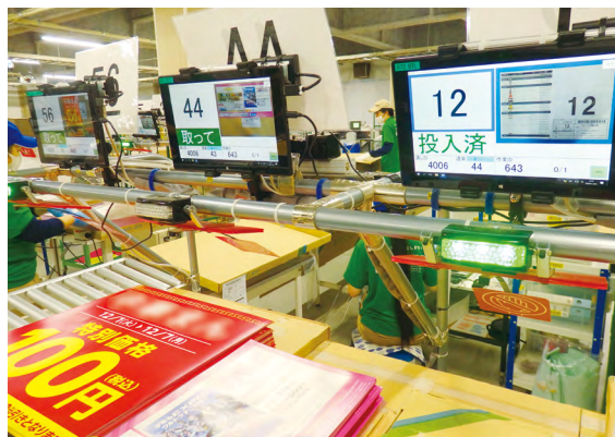
販促物の配送ルートを集約することで配送コストを削減（上）、データベースに連結した専用ピッキングライン（下）

人口減少を背景に小売りや流通の現場でも生産性向上が求められる。そのカギを握るのが、いかに無駄をなくし、価値ある業務に時間を割けるかという視点だろう。水上印刷はそこにビジネス